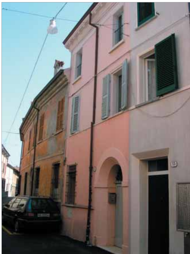
Via Garzoni 11 Fronte Principale